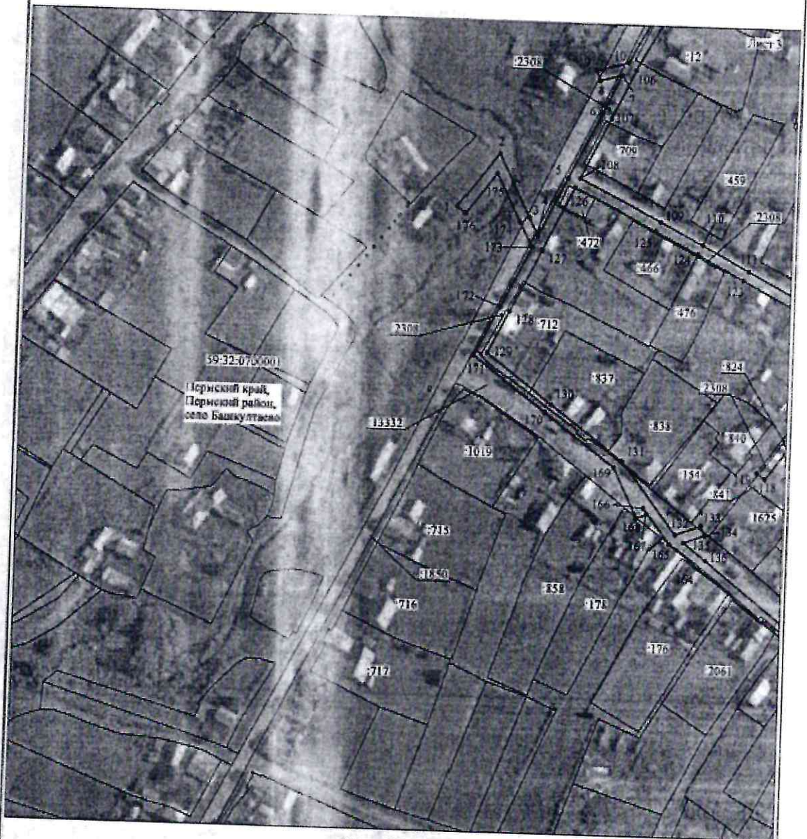
Схема расположения границ публичного сервитута объекта